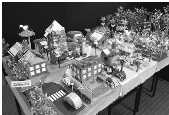
Publiczna Szkoła Podstawowa nr 6 w Nowej Soli, praca uczniów klasy 3, opiekunka: Iwona Pawłowicz-Sznajder