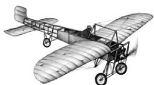
Samolot Louisa Blériota

Po balonach nadszedł czas samolotów. 17 grudnia 1903 roku Amerykanin Orville Wright dokonał pierwszego, historycznego lotu samolotem. Lot ten trwał tylko 12 sekund, a pokonana odległość wynosiła 36 metrów. Próby z samolotami przeprowadzano także w Europie. Wielkim wydarzeniem był przelot Francuza Louisa Blériota nad kanałem La Manche 1 w dniu 25 lipca 1909 roku. Za ten wyczyn Blériot otrzymał od jednej z brytyjskich gazet 1000 funtów nagrody.