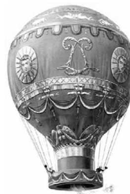
Balon braci Montgolfier

Kolejny balon braci Montgolfier, już z człowiekiem (był nim Franciszek Pilatre), wzbił się 5 w powietrze 15 października 1783 roku. Wzniósł się 6 on – wśród oklasków zebranych ludzi – na wysokość 25 metrów i pozostawał w górze przez prawie 4 minuty. 21 listopada Franciszek Pilatre wykonał także pierwszy lot nad Paryżem, przebywając w powietrzu około 25 minut.